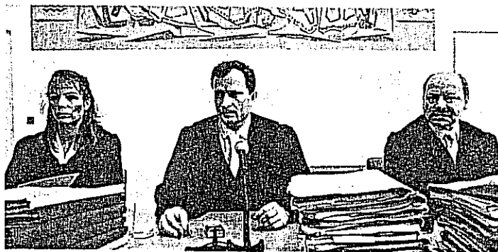
Mainzer Gericht*: Katastrophen sind vermeidbar

Justizkatastrophen sind vermeidbar. Die Justiz muß nicht schicksalhaft Menschen zum Verhängnis werden. Jedesmal, das zeigen die Freisprüche in Mißbrauchsverfahren wie Münster, Osnabrück oder Mainz, stand am Anfang gutgemeinter, hektischer und dilettantischer Aktionismus gegen das Phantom „Mißbrauch“, der Kritik und Selbstkritik nicht zuließ. In der Be-